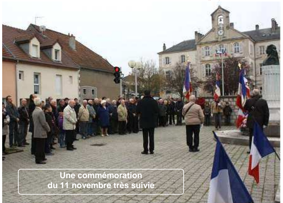
Une commémoration du 11 novembre très suivie