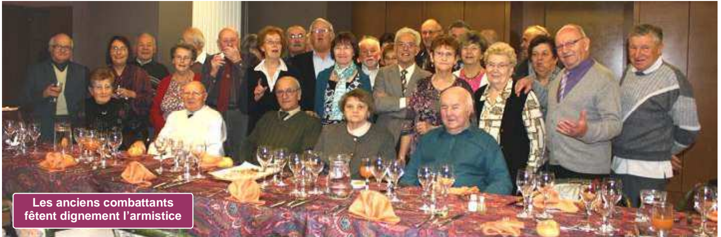
Les anciens combattants fêtent dignement l'armistice