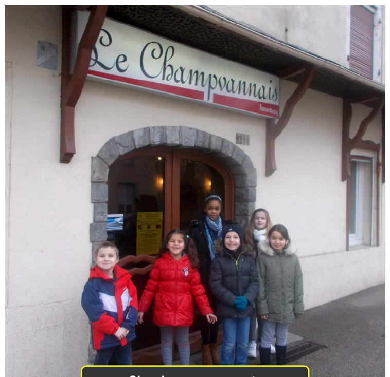
Chez les commerçants

Contact : 03.84.82.57.65 alsh.ouest-champvans@grand-dole.fr