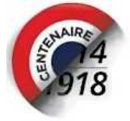
Inauguration du monument aux morts : le 27 juin 1920