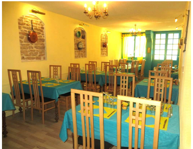
Une salle chaleureuse d'une trentaine de couverts

DP : Dans un premier temps oui, même si je n'écarte pas plus tard de les faire "à emporter" mais dans l'immédiat ce n'est pas à l'ordre du jour.