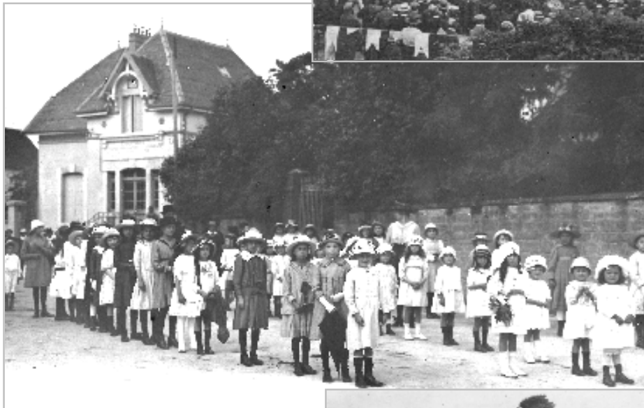
Le cortège de retour du cimetière