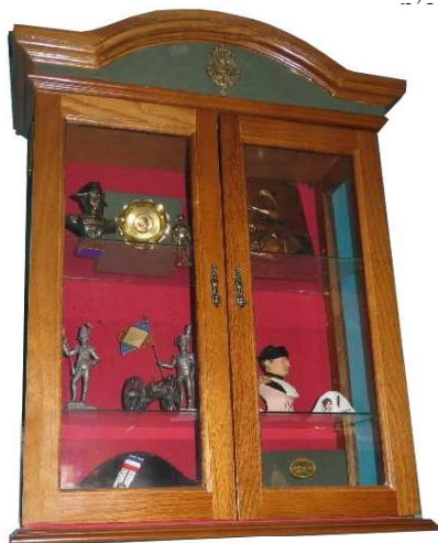
Napoléon aurait séjourné dans cette ancienne auberge

Champvans infos : Quand j'ai téléphoné pour prendre rendez-vous, vous m'avez dit "non aujourd'hui je ne peux pas je suis complet, demain également" je me suis dit super, ça marche !