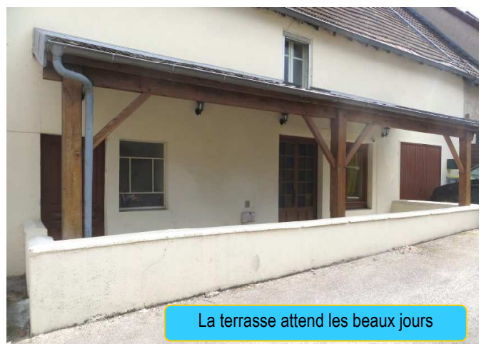
La terrasse attend les beaux jours

De même je suis fermé l'après-midi, étant tout seul, j'ai besoin de faire des breaks, mais j'ai également besoin d'un temps de préparation pour la restauration du soir. Si je suis au bar, appelé toutes les cinq minutes, je ne peux pas être efficace en cuisine.