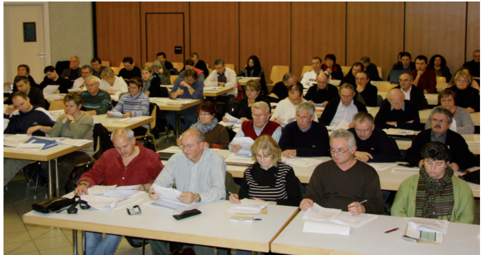
Réunis à Champvans le 17 décembre dernier, les délégués du Grand Dole ont voté à l'unanimité leur soutien au protocole d'accord Solvay-Dalkia-Grand Dole relatif à l'implantation d'une unité biomasse

Je terminerai, en vous souhaitant à tous de joyeuses fêtes de fin d'année et vous donne rendez-vous à l'année prochaine. Dès le 5 janvier, pour certains, et le samedi 17 pour vous tous, lors de la présentation des vœux communautaires.