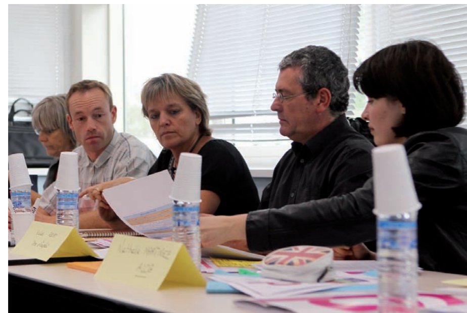
Les responsables des structures d'insertion du territoire ont répondu à l'appel du Grand Dole

Le Grand Dole s'appuiera sur huit structures locales d'insertion pour permettre à 230 personnes de renouer avec le monde du travail