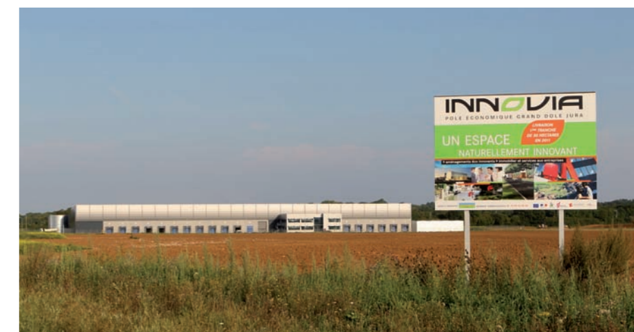
Stanley Black&Decker a ouvert son bâtiment sur Innovia début août

Des Epenottes à Innovia, en passant par Foucherans et Choisey, les zones économiques du Grand Dole sont en pleine mutation.