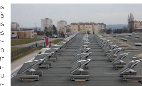
La technologie "héliotrope" a été choisie

Ils ont poussé comme des champignons en début d'année, mais ils ne sont bons à consommer que depuis début août. Les 88 panneaux photovoltaïques installés sur le toit du CAN sont désormais raccordés à ERDF, et fonctionnent à plein régime. Ils génèrent environ 80 kWh par jour, soit l'équivalent de la consommation de 10 foyers. Un rendement rendu possible grâce à la particularité du système, installé par la société Sequanie Energie : les panneaux sont en effet héliotropes, et pivotent sur eux-mêmes pour suivre le déplacement du soleil. Une astuce permettant de générer 30% d'électricité supplémentaire. La totalité de la production est aujourd'hui revendue à ERDF, mais le Grand Dole a d'ores et déjà engagé des démarches pour utiliser cette énergie pour alimenter le bâtiment du CAN, qui pourrait vivre en partie en autonomie.