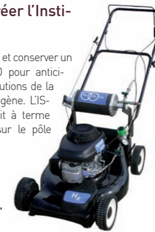
La tondeuse à hydrogène, conçue par Mahytec

du marché ; et conserver un centre R&D pour anticiper les évolutions de la filière hydrogène. L'ISTHY pourrait à terme s'installer sur le pôle Innovia.