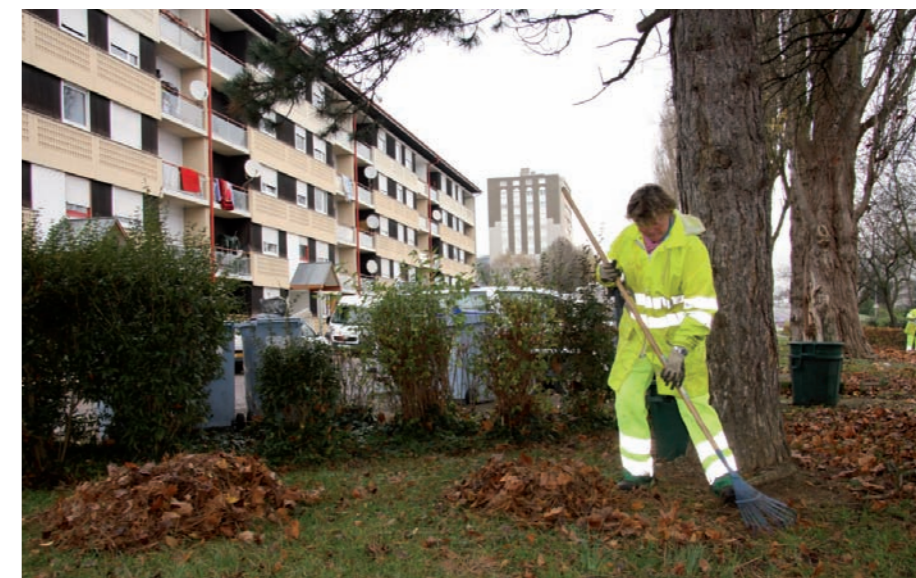
Les salariés de la régie sont tous issus du quartier des Mesnils Pasteur

Depuis le 2 août 2010, le centre d'activités nouvelles héberge la toute nouvelle régie de quartier des Mesnils Pasteur