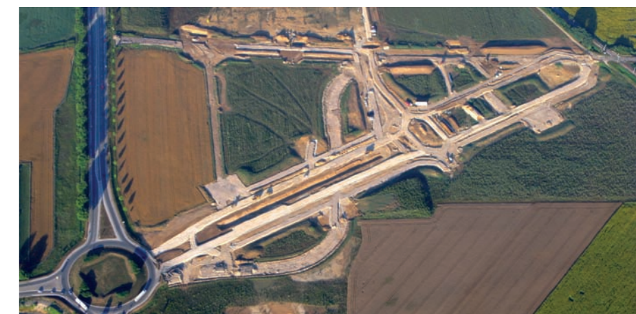
Stanley s'est associé à Gazley Logistics pour acquérir une parcelle de 4,3 ha sur Innovia

Le groupe d'outillage Stanley Black & Decker s'implantera sur le pôle d'activités Innovia en 2011. Le projet prévoit la création d'un bâtiment de 18 000 mètres carrés et générera 40 emplois directs.