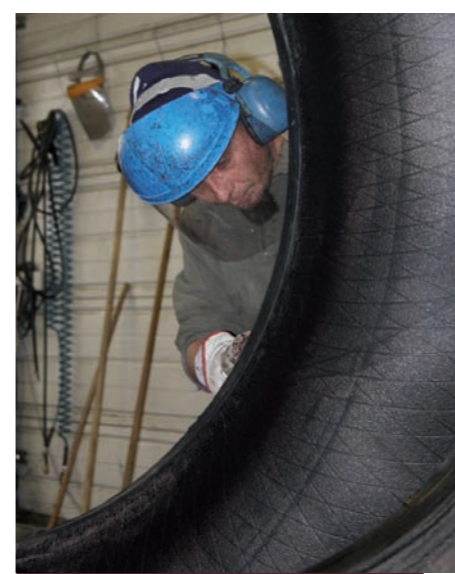
Néovia répare 2 000 pneumatiques par an

n'en oublie pas qu'il est passé par une pépinière d'entreprises pour grandir : "Nous bénéficions de conditions idéales au centre d'activités nouvelles : un atelier de très bonne qualité, un loyer modéré incluant des services comme Internet, pour débiter c'était vraiment bien." Place désormais à une nouvelle aventure, en totale autonomie.