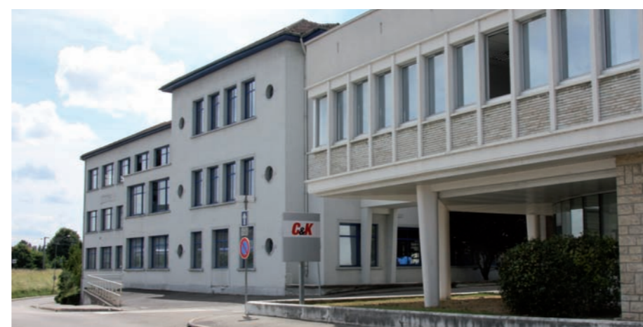
La réhabilitation du site est estimée à 2,8 millions d'euros

A l'initiative du Grand Dole, le bâtiment rue Louis de la Verne va accueillir des activités à vocation économique en 2011