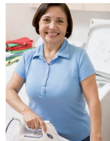
Le secteur des services à la personne croît chaque année. Le Grand Dole souhaite structurer l'offre

Nous n'y échapperons pas : avec un vieillissement de la population de plus en plus caractérisé, les services à la personne vont forcément croître dans les années à venir. Le champ des services à domicile couvre un éventail de métiers encadrés par des professionnels formés et qualifiés depuis les services à la famille jusqu'aux services aux personnes dépendantes, en passant par les