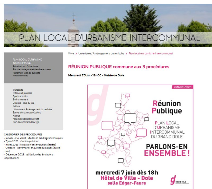
Publication sur le site internet du Grand Dole.

Cette réunion, commune aux trois procédures d'évolution, a été annoncée sur la plateforme « Sortir à Dole », par la pose d'affichettes dans les communes, dans les mairies du Grand Dole et à l'entrée du pôle Aménagement et Attractivité du territoire du Grand Dole, sur les réseaux sociaux et sur la page internet dédiée au PLU du Grand Dole et sur les sites communaux. Cette information a été doublée sur Dole par l'utilisation des panneaux d'information lumineux.