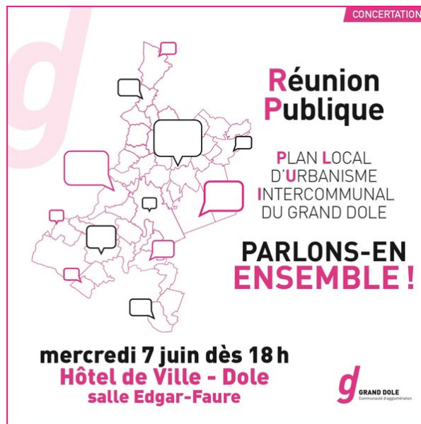
Visuel d'information pour la réunion publique.