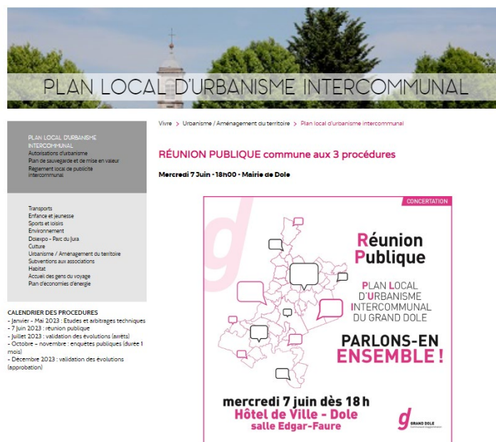
Publication sur le site internet du Grand Dole.

Cette réunion, commune aux trois procédures d'évolution, a été annoncée sur la plateforme « Sortir à Dole », par la pose d'affichettes dans les communes, dans les mairies du Grand Dole et à l'entrée du pôle Aménagement et Attractivité du territoire du Grand Dole, sur les réseaux sociaux et sur la page internet dédiée au PLUi du Grand Dole et sur les sites communaux. Cette information a été doublée sur Dole par l'utilisation des panneaux d'information lumineux.