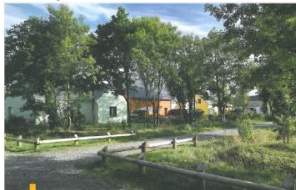
Quartier, la chapelle des Marais (44)

Proposer des formes urbaines, intégrées à un cadre paysager sensible, en ménageant l'intimité des résidents