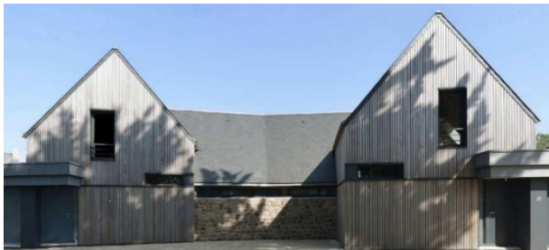
Maisons jumelles, SABA Architectes, Perros-Guirrec