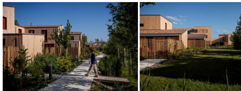
60 logements BBC, Chanteloup en Brie, Harari Architectes - D'ici là paysages et territoires