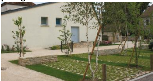
Exemple de parking paysager