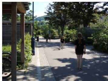
Rue résidentielle partagée Fribourg, Allemagne