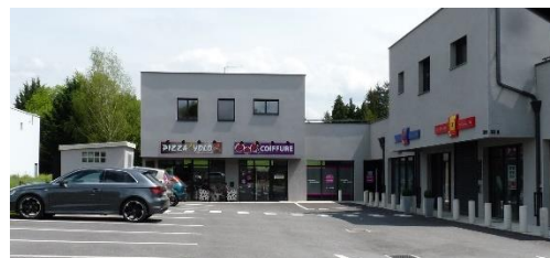
Cellules commerciales, Rioz (70)

Accompagner la traversée du bourg (stationnements, passages sécurisés, traitement des caniveaux...)