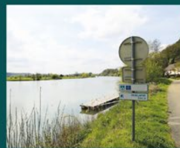
Le moulin et la centrale hydroélectrique, surplombant le Doubs.

Le site du Moulin Rouge, qui s'étend de Rochefort-sur-Neon à Orchamps, fait partie de l'EuroVélo 6 reliant l'Atlantique à la Mer Noire. Propice aux modes de déplacement doux (roller, vélo...), la balade au fil de l'eau offre un cadre paisible et ressourçant, longeant les maisons de villégiature situées en bordure du Doubs.