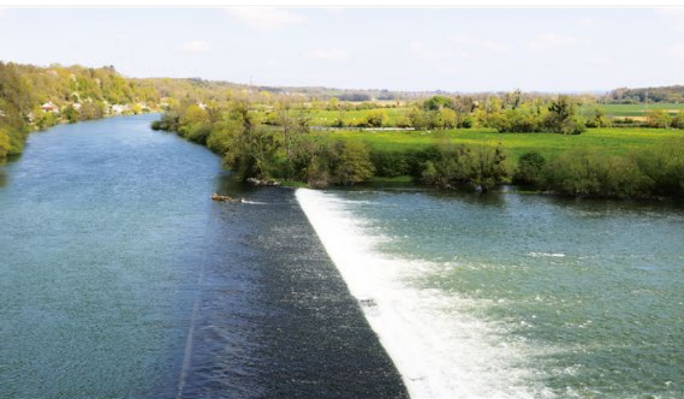
Le barrage du Doubs au niveau de l'écluse du Moulin Rouge.

Au cœur de la commune d'Audelage, le site du Moulin Rouge s'étend sur plusieurs kilomètres, entre les écluses 63 et 64 du Canal du Rhône au Rhin. Datant du 12 e siècle, l'emblématique moulin à grains a d'abord été la propriété des Ducs de Bourgogne.