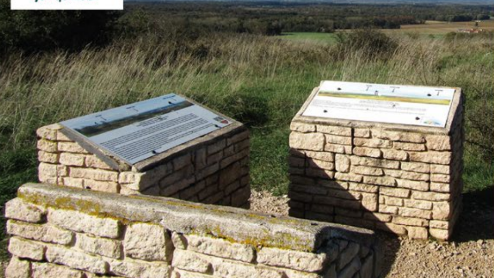
Panorama du Mont Joly au Mont Roland.

De février à avril, place à une cueillette raisonnée des jonquilles.