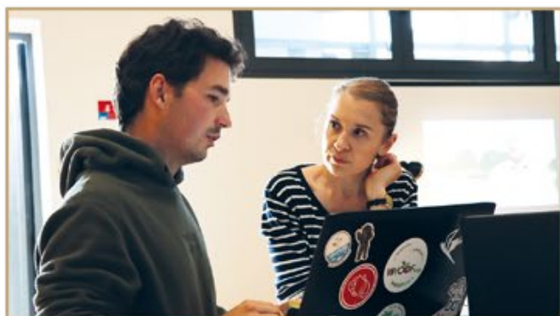
Entre pratiques et conseils, les nouveaux entrepreneurs ont désormais les bases pour réussir !

Le 11 mai dernier s'est tenu l'évènement «Entreprendre dans son quartier», à la salle Françoise-Dolto du quartier des Mesnils Pasteur de Dole.