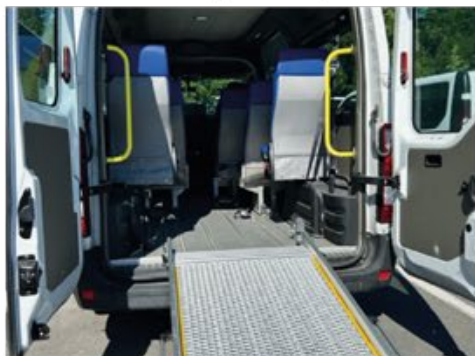
Des véhicules adaptés aux PMR.

Service réservé aux titulaires d'une carte mobilité inclusion égale ou supérieure à 80 %.