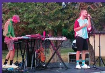
Le duo parisien Hanami sur la scène de Gevry.

Pour sa neuvième édition, le festival, imaginé par le Moulin de Brainans et l'association Promodegel et soutenu par le Grand Dole, a fait souffler un vent de fraîcheur musical sur le territoire. Faire découvrir les artistes de la scène émergente française au plus près des habitants, en partenariat avec les collectivités et associations locales, telle est la promesse du festival.