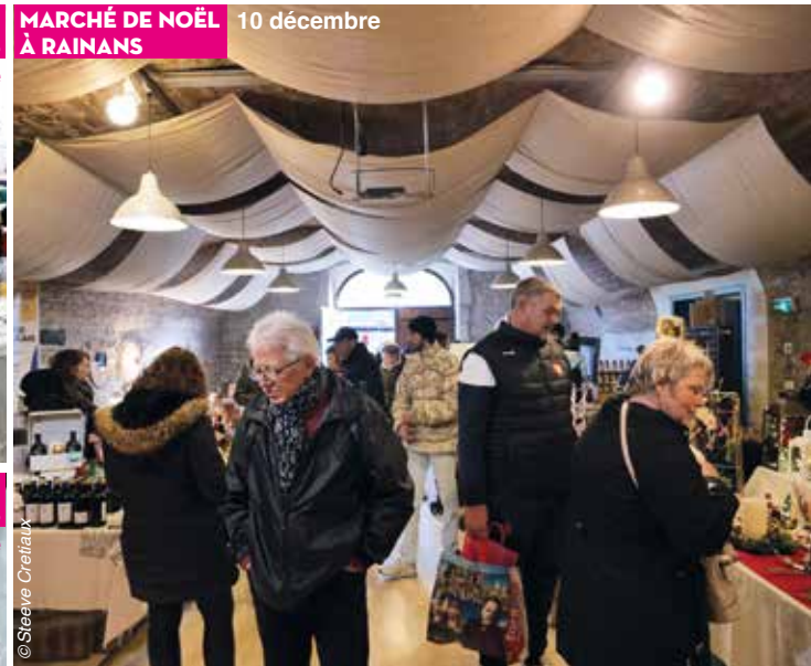
MARCHÉ DE NOËL À RAINANS 10 décembre