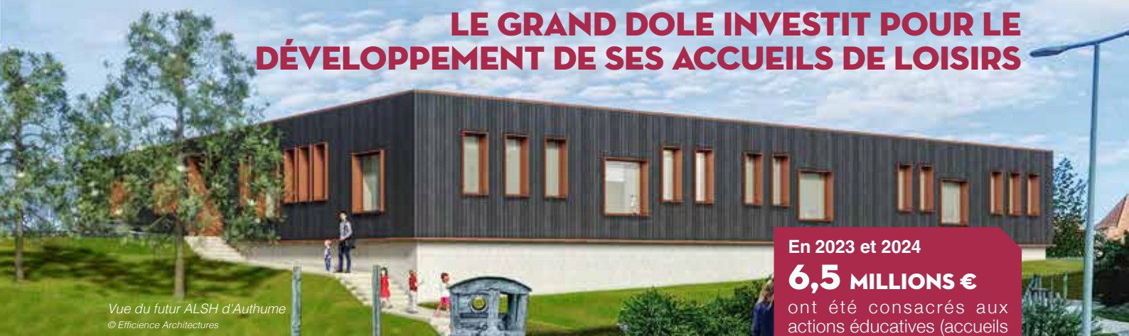
Vue du futur ALSH d'Authume © Efficience Architectures