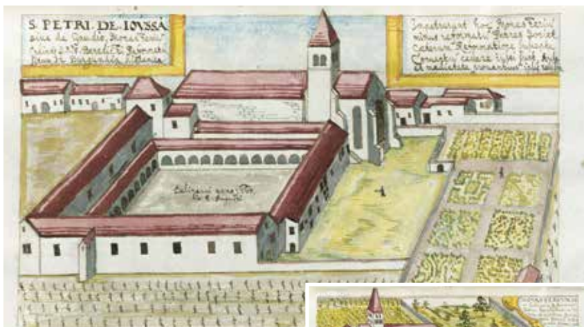
Le prieuré Saint-Pierre de Jouhe

Humaniste, homme de science aux compétences universelles, historien, théologien, généalogiste, globe-trotteur infatigable... les souvenirs qu'il a gardés des établissements monastiques visités sont conservés sous forme de dessins aquarellés dans un journal de voyage (conservé aujourd'hui en Allemagne). Les abbayes jurassiennes n'ont donc pas échappé à son œil avisé et à sa main assurée. Lors d'un voyage en 1665, à l'âge de 69 ans, Gabriel