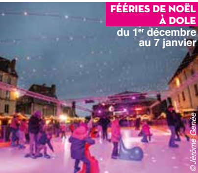
FÉÉRIES DE NOËL À DOLE du 1 er décembre au 7 janvier

Du 26 novembre 2023 au 7 janvier 2024, les communes du Grand Dole ont revêtu leurs plus belles parures de Noël pour célébrer les fêtes de fin d'année. De nombreuses festivités ont eu lieu sur l'ensemble du territoire : animations, marchés, spectacles, goûters, concerts, illuminations... de quoi faire rêver les petits et grands enfants ! Retour en images sur quelques moments forts de cette période féérique.