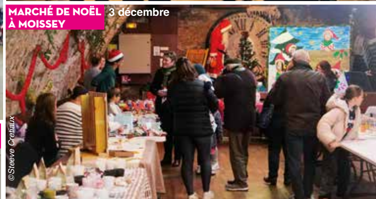
MARCHÉ DE NOËL À MOISSEY 3 décembre