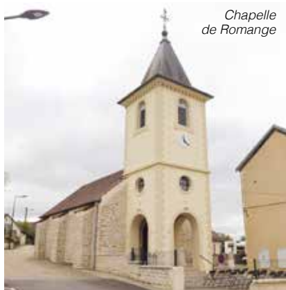
Chapelle de Romange

À pied, à vélo, en roller... qu'elles soient contemplatives ou sportives, nul doute que vous trouverez votre bonheur parmi les nombreuses opportunités de randonnées et de découvertes qu'offrent les 47 communes de l'Agglomération. Alors, bon voyage dans le Grand Dole !