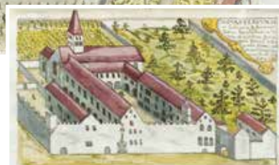
Le collège clunisien Saint-Jérôme à Dole