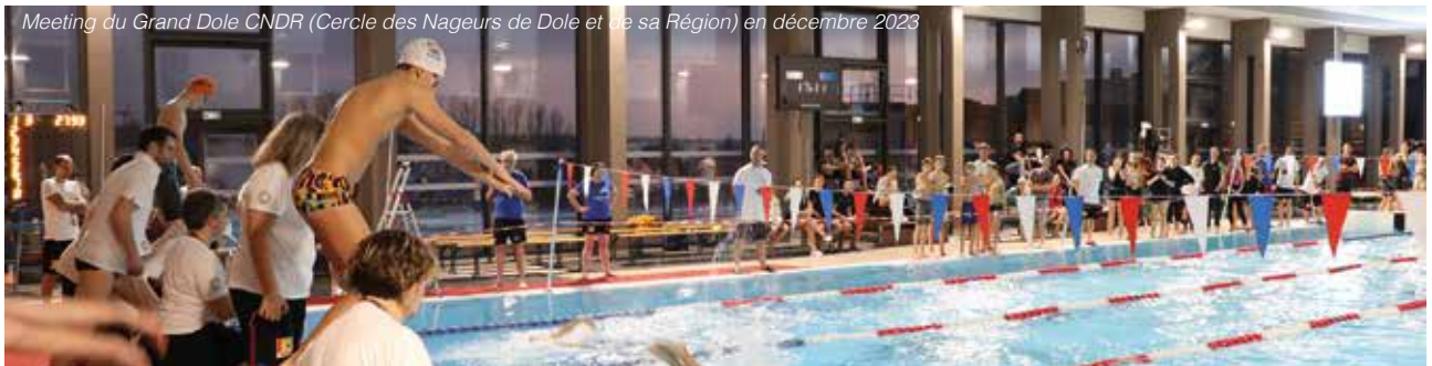
Meeting du Grand Dole CNDR (Cercle des Nageurs de Dole et de sa Région) en décembre 2023

Véritable lieu de vie dédié aux activités sportives, l'Espace aquatique Pierre-Talagrand offre à ses usagers tout ce qu'il faut pour profiter des joies de l'eau. Mais les visiteurs ne sont pas les seuls à pouvoir bénéficier de cette infrastructure. Cet équipement sportif innovant et unique dans la région répond aussi aux besoins de nombreuses associations, notamment aquatiques.