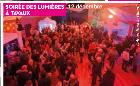
SOIRÉE DES LUMIÈRES À TAYAX 12 décembre