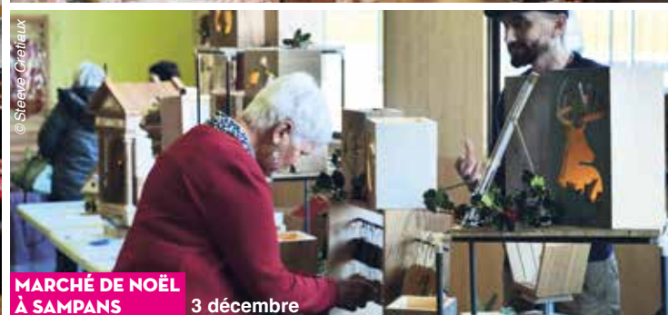
MARCHÉ DE NOËL À SAMPANS 3 décembre