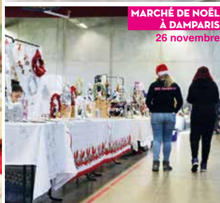
MARCHÉ DE NOËL À DAMPARIS 26 novembre