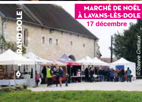
MARCHÉ DE NOËL À LAVANS-LÈS-DOLE 17 décembre