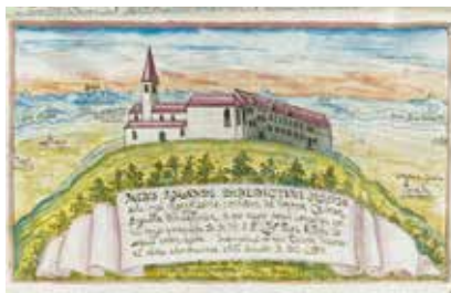
Le sanctuaire du Mont-Roland