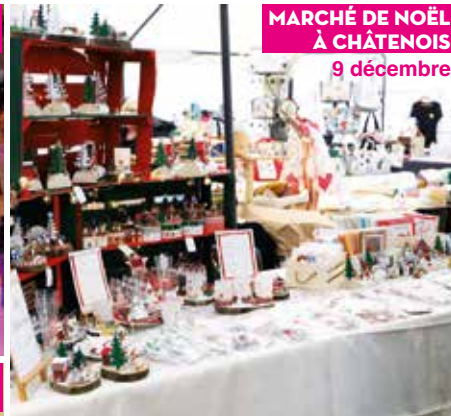
MARCHÉ DE NOËL À CHÂTENOIS 9 décembre