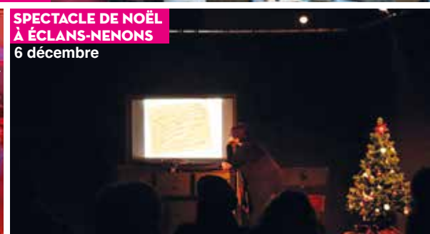
SPECTACLE DE NOËL À ÉCLANS-NENONS 6 décembre