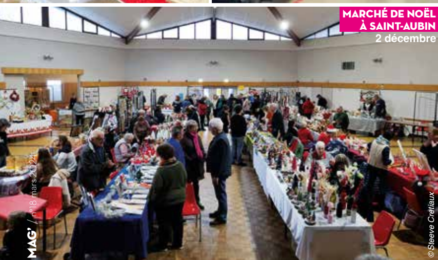
MARCHÉ DE NOËL À SAINT-AUBIN 2 décembre