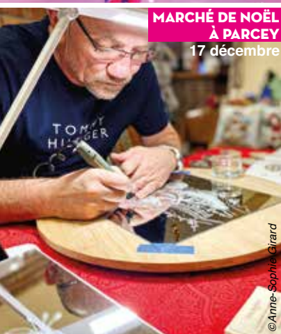
MARCHÉ DE NOËL À PARCEY 17 décembre