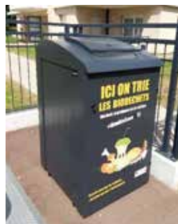
Exemple de Point d'Apport Volontaire en habitat collectif.