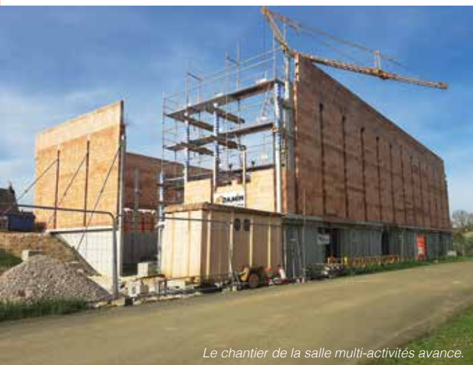
Le chantier de la salle multi-activités avance.

Disponible à la rentrée prochaine, le nouvel équipement multisports de plus de 1 000 m 2 à Rochefort-sur-Nenon bénéficiera aux différents utilisateurs : clubs, scolaires et loisirs. Cet équipement permettra aux 160 enfants du regroupement scolaire des communes de Rochefort, Falletans, Audelange, et Éclans-Nenon de bénéficier de structures sportives neuves et adaptées. Il sera aussi un lieu de loisirs pour les habitants et accueillera le Rochefort Tennis Club qui pourra organiser ses compétitions. Enfin, basketball, futsal, volleyball, badminton, auront tout autant leur place et à l'étage supérieur, l'association Pas D'Léopard profitera des nouveaux blocs d'escalade.