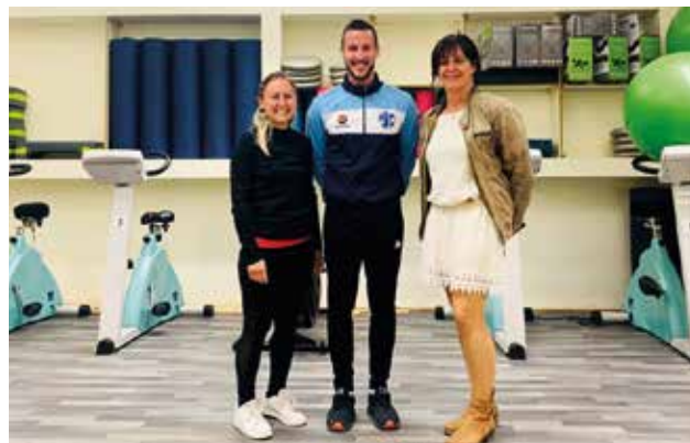
L'équipe indépendante coordination et activités.

Souvent méconnues par le public, les Maisons Sport Santé ont à cœur d'accueillir, informer, accompagner et orienter de nombreuses personnes aux profils différents. Ouvertes à tous, elles sont présentes notamment pour les personnes en bonne santé, qui n'ont jamais pratiqué de sport, ou n'en ont pas fait depuis longtemps et veulent s'y remettre avec un accompagnement. Elles accueillent également des personnes souffrant d'affections de longue ou courte durée et qui ont besoin d'une activité physique adaptée, sécurisée par des