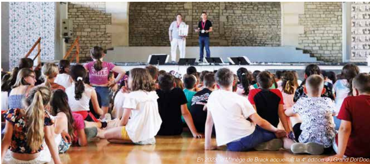
En 2023, le Manège de Brack accueillait la 4 e édition du Grand Dol'Doc.

En écho aux Jeux Olympiques organisés en France cet été, le réseau des médiathèques du Grand Dole invite cette année 11 classes de CM1-CM2 à lire quatre ouvrages documentaires sur le thème du sport. Les élèves, avec l'aide des bibliothécaires et de