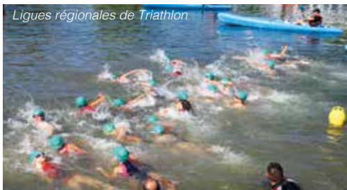
Ligues régionales de Triathlon