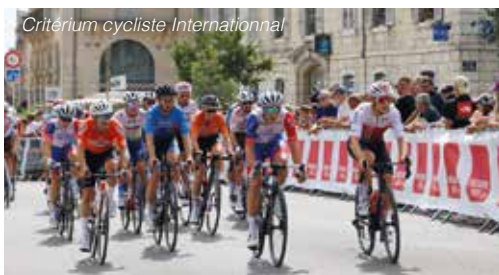
Critérium cycliste International