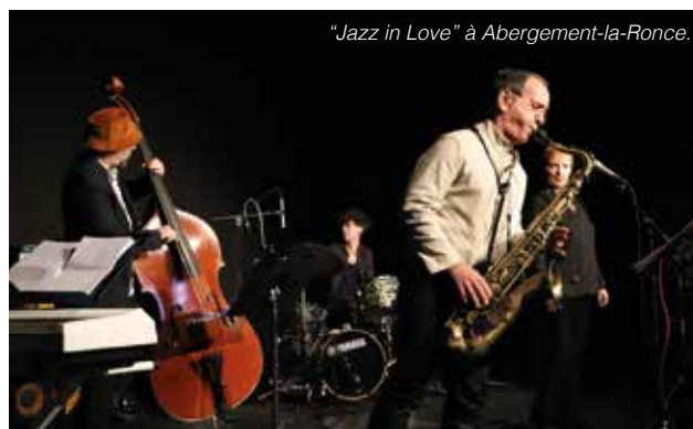
"Jazz in Love" à Abergement-la-Ronce.