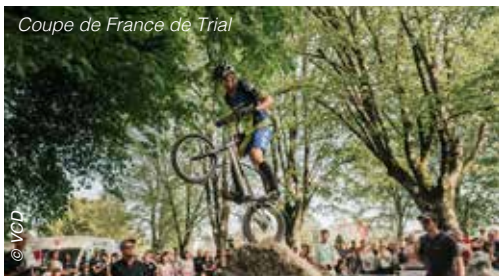
Coupe de France de Trial