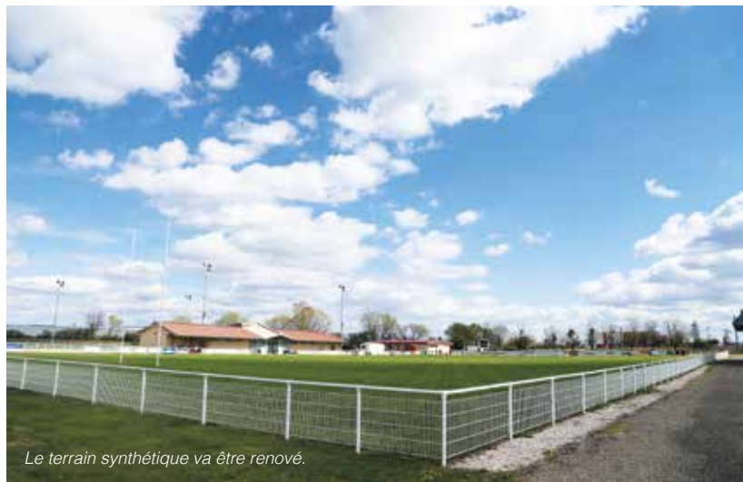
Le terrain synthétique va être renové.

Utilisé principalement par le club du Grand Dole Rugby, le stade de la Pépinière se verra bientôt doté d'un nouveau terrain synthétique et d'un nouveau système d'éclairage. Le terrain sera lui aussi composé de liège, matériau non polluant permettant un meilleur vieillissement, pour un plus grand nombre d'heures d'utilisation. Les travaux viennent tout juste de débuter et devraient être achevés pour la reprise de la saison en septembre.