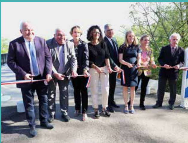
Les élus étaient présents pour inaugurer cet ouvrage important.