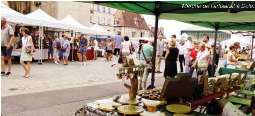
Marché de l'artisanat à Dole.