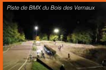
Piste de BMX du Bois des Vernaux