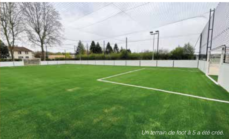
Un terrain de foot à 5 a été créé.