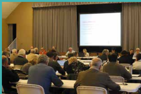
Le 21 mars, le Conseil communautaire se prononçait positivement pour la signature de la convention d'attribution des Fonds de Concours.

• 2 DOSSIERS INTERCOMMUNAUX , d'une valeur totale de 432 566 € , observeront également un soutien financier de la Communauté d'Agglomération du Grand Dole à hauteur de 123 191 € .