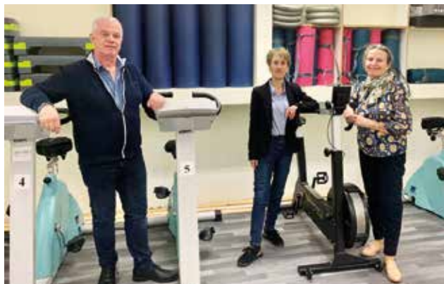
L'équipe bénévole de l'association.