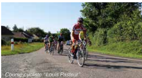
Course cycliste "Louis Pasteur"